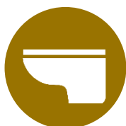
トイレリフォーム