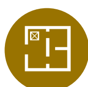
間取変更リフォーム