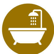
お風呂リフォーム